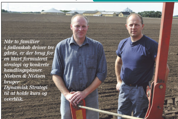
Når to familier i fællesskab driver tre gårde, er der brug for en klart formuleret strategi og konkrete handlingsplaner. Nielsen & Nielsen bruger Dynamisk Strategi til at holde kurs og overblik.